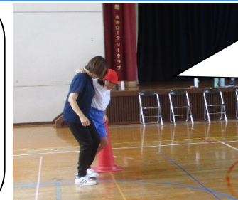
5年生 二人三脚中 息が合っています!