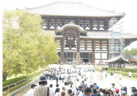
東大寺、あの中に大仏が…