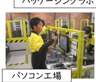
パッケージングラボ