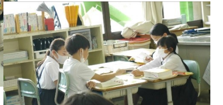
4年生…国語科「いろいろな意味を持つ言葉」辞書を使ったり、話し合ったり、発見がいっぱいでした。