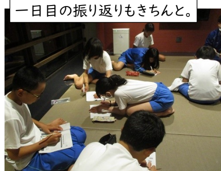
一日目の振り返りもきちんと。