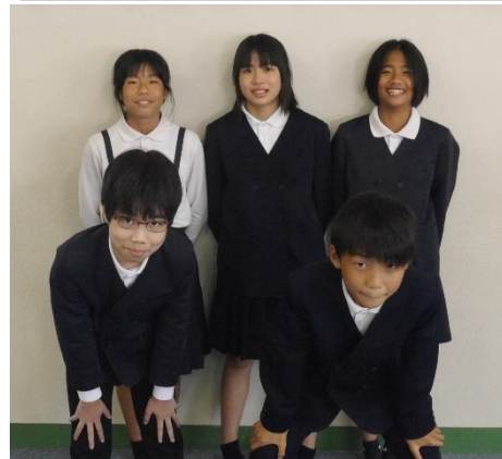
令和5年度 後期児童会役員メンバー

5年生が選挙管理委員を務めてくれましたが、初めての告示から、選挙結果の放送まで緊張感を持ってやってくれました。