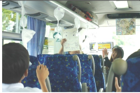
バスの中もみんなで盛り上がりました。