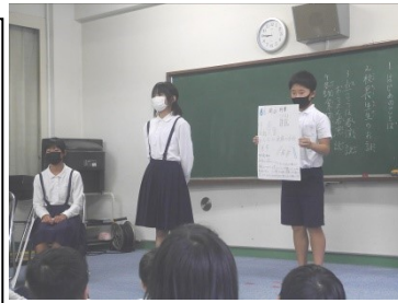
集会室で最後の演説

5名の役員に、5名の立候補でしたので、信任投票となりました。6年生は、学校を引っ張っていくのは自分たちという思いで、立候補者の勇気を支え、学級みんなで選挙に向けて準備をしてきました。どんな学校にしたいのか立候補者と応援者が話し合う中でどんどんイメージが明確になり、投票当日には、堂々と演説する姿を見せてくれました。みんなで選んだ役員5人、しっかり応援していきたいと思います。