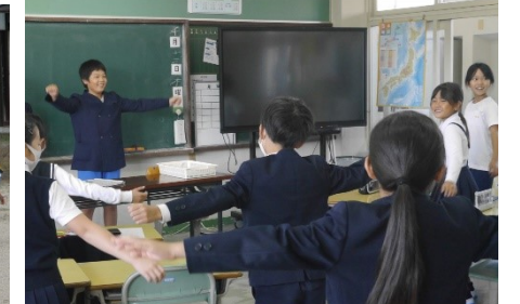
生活委員会が考えて、朝会の時間に各学級でラジオ体操の練習をしています。