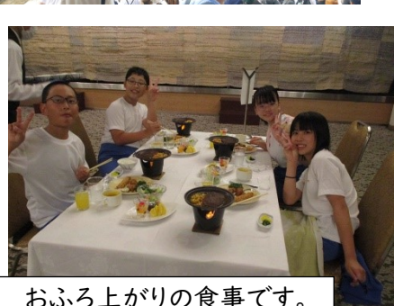
お風呂上がりの食事です。