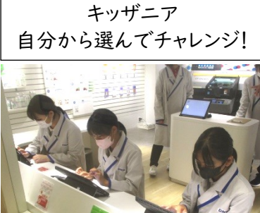
キツザニア 自分から選んでチャレンジ!