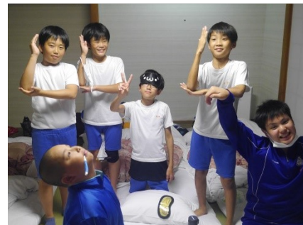
ホテルの部屋で。 楽しさが表情に出ています。