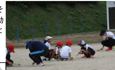
朝会や掃除の時間を使って草取りをしています。これも大切な準備です。