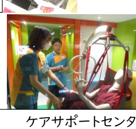
ケアサポートセンター