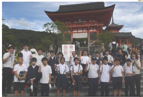
金閣寺の後、清水寺の入り口で。