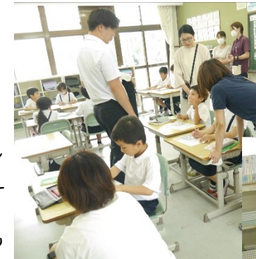
2年生…国語科「ことばでみちあんない」おうちの方に助けてもらってよかったね。

この日は、PTA学級部主催の学級懇談会も開催され、夏休みの様子や、2学期になってからの子どもたちの様子等交流していただきました。