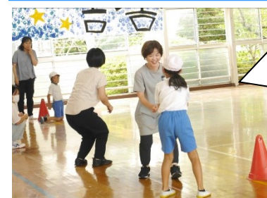
3年生 やきそばじゃんけん、楽しそう!