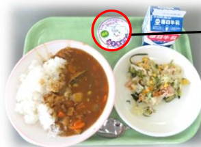
新給食センターによる初給食。ゼリーの蓋に「開所記念」の文字が。