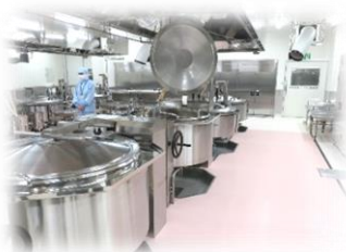
新給食センターの巨大釜