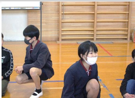
グループごとに自己紹介と名前覚え