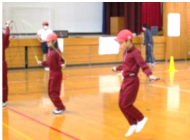
個人跳び(跳び方は各自で選択)