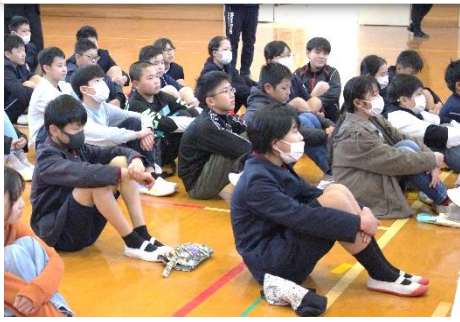
開会式での4小学校の6年生