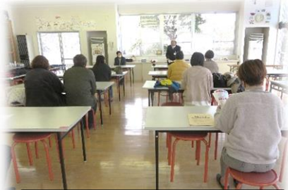
保護者対象の説明会