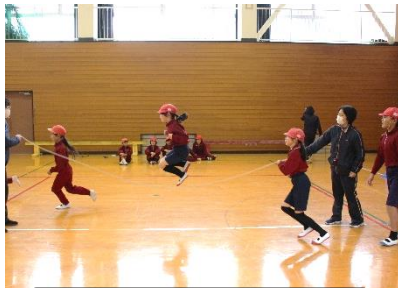
縦割り班ごとの8の字跳び

【低・中・高学年別の8の字跳びの結果(3分間で跳んだ延べ回数)】 1・2年生… 50回 3・4年生… 157回 5・6年生… 240回