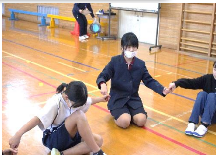
親睦を深めるゲーム

1月29日（月）5・6時間目、田幸小学校体育館を会場に、塩町中学校区内の4小学校の6年生が交流授業を行いました。