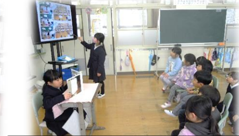
入学予定児童の園児と現1・2年生の交流の様子